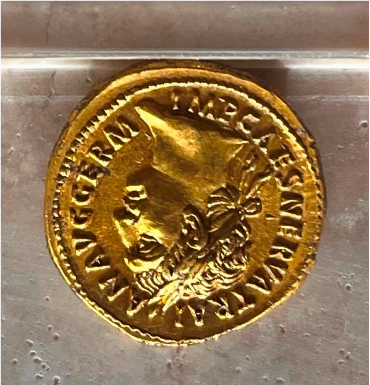
Aureo di Traiano fior di conio

Ex voto con gambe, pedi, braccia, mostra al Quirinale