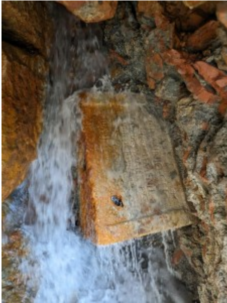
Altare del tempio prima della rimozione dalla vasca

Non solo bronzi ma anche marmi dal tempio di Apollo a s. Casciano dei Bagni