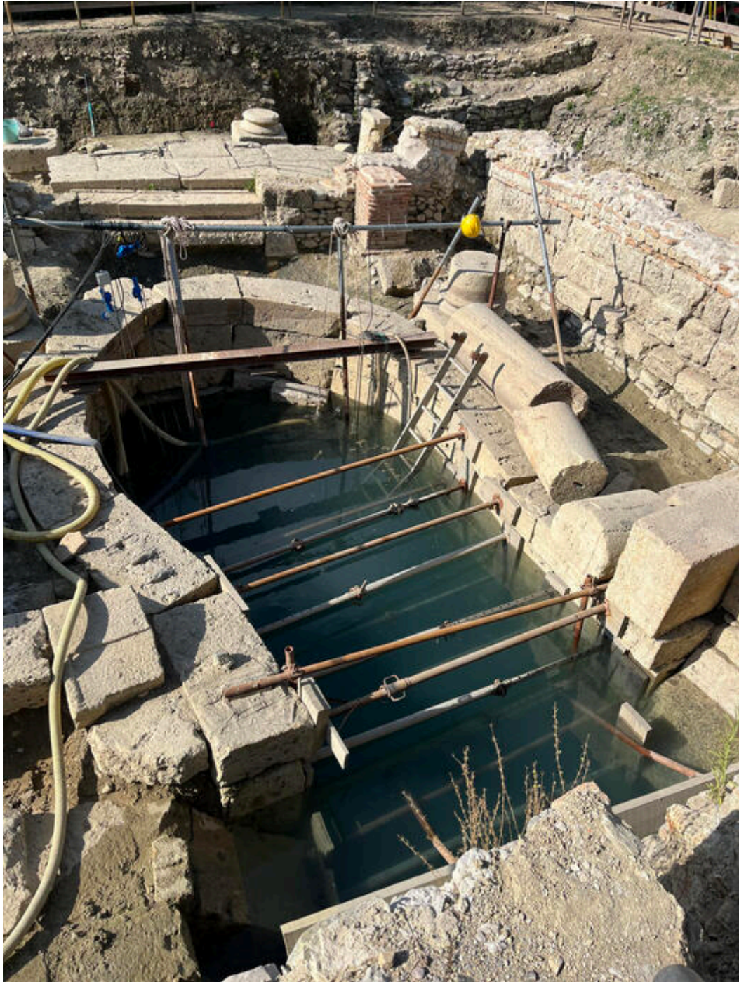
La grande vasca sacra di San Casciano. Al suo interno la sorgente con l'acqua che sgorga a 42 gradi.

Non solo bronzi ma anche marmi dal tempio di Apollo a s. Casciano dei Bagni