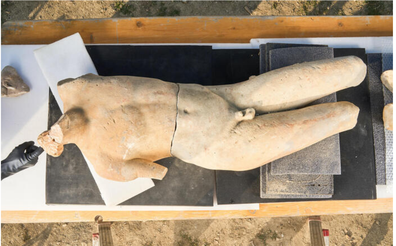
I frammenti del giovane Apollo in marmo allineati sul luogo dello scavo. La statua, copia romana da Prassitele, è stata scolpita utilizzando marmo greco.

Non solo bronzi ma anche marmi dal tempio di Apollo a s. Casciano dei Bagni