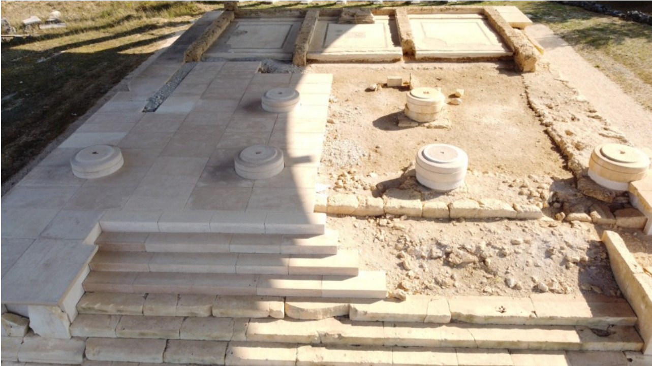
La scalinata del secondo tempio e le tre celle

Perché un remoto centro montano abruzzese innalzò un tempio alla Triade?