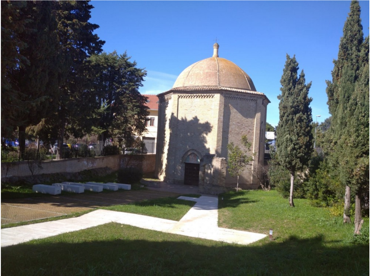
Chiesa ottagonale di Tricalle (Chieti), edificata sul tempio di Diana Trivia

L'antichissima frequentazione italica dei luoghi appenninici ci ha lasciato molte e preziose attestazioni archeologiche e architettoniche, oltre che una ricca tradizione che ha saputo adattarsi al mutare dei costumi, sopravvivendo in forma modificata fino ai giorni nostri.