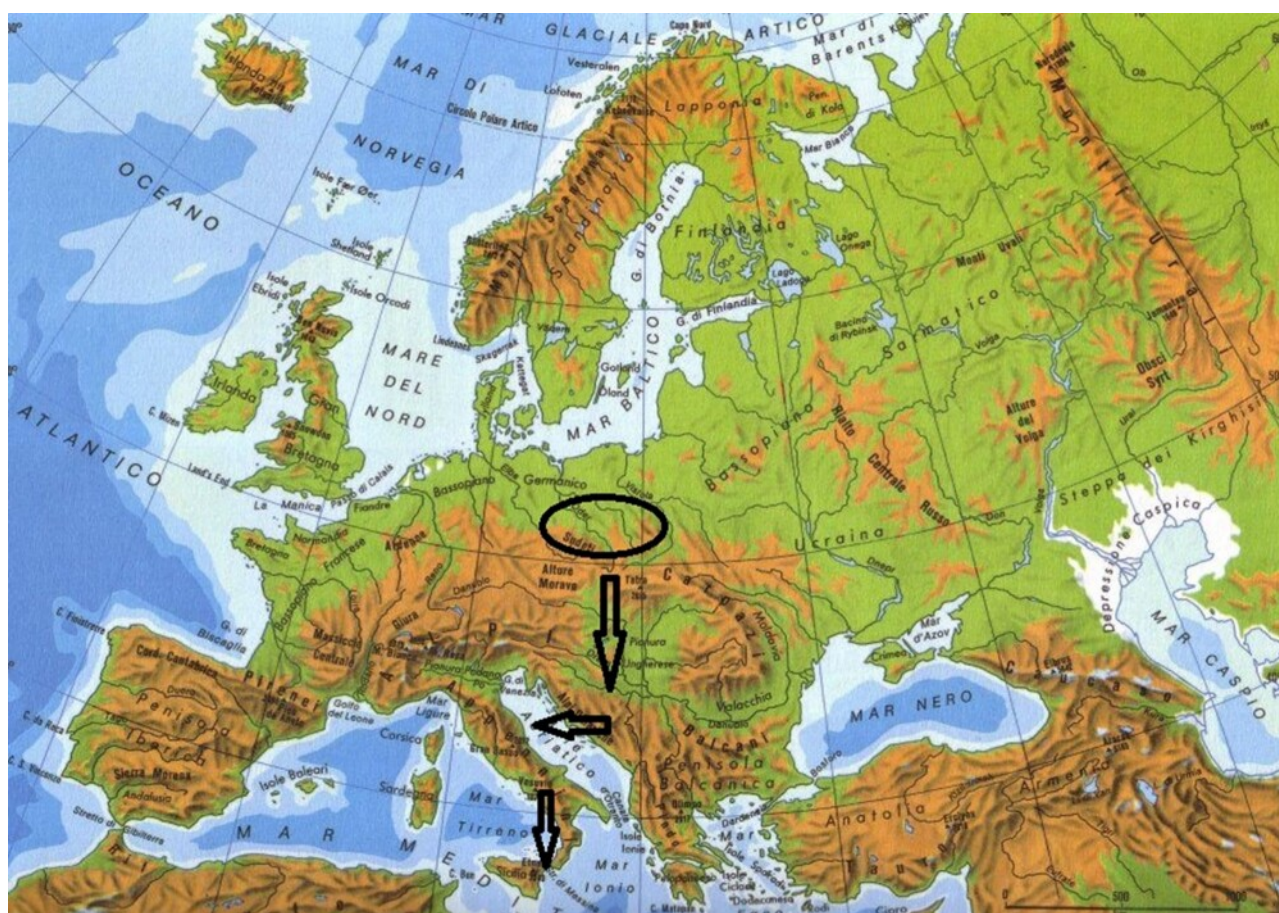
L'Urheimat dei proto-illiri individuata dallo scrivente tramite glottocronologia, situata

Per quanto riguarda le antiche attestazioni dell' ethnos dei Siculi all'infuori della Sicilia/Sikelia e dunque in ambito peninsulare, voglio prima ricordare, come ha già fatto Jean Berard nel suo monumentale libro La Magna Grecia [1] , che prima Pausania e poi Dione Crisostomo hanno parlato della collina alle porte di Atene che prese il nome Sikelia [2] . Ma non lasciamoci prendere dal desiderio di fare strane congetture per trarne false conclusioni, poiché il nome deve avere delle origini pressoché recenti. E su questo, lo scrivente e Berard mostrano pensiero unanime. Così come per Naxos , la colonia siciliana euboica, che secondo alcuni fu fondata da quegli Elleni di stirpe ionica guidati dall'ateniese Tucle/Teocle , abitanti un'isola (la Nasso egea) ove una volta giunsero Traci al seguito di un loro re di nome Sikelòs [3] , si è arrivati al punto di mettere in relazione questa tradizione con il nome di "Piccola Sicilia" che venne dato alla colonia nassia siciliana in onore a questo re trace. E questo mi pare del tutto infondato, sempre in linea con Berard.