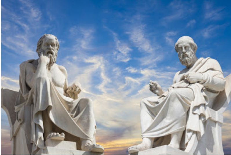
Socrate e Platone

In Platone non c'è dualismo: mente e mondo sono in rapporto inseparabile