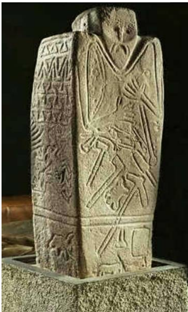
Idolo di Kernosovsky: 3000-2500 aev

Urheimat europea: un grande albero o un fiume in piena con effluenti?