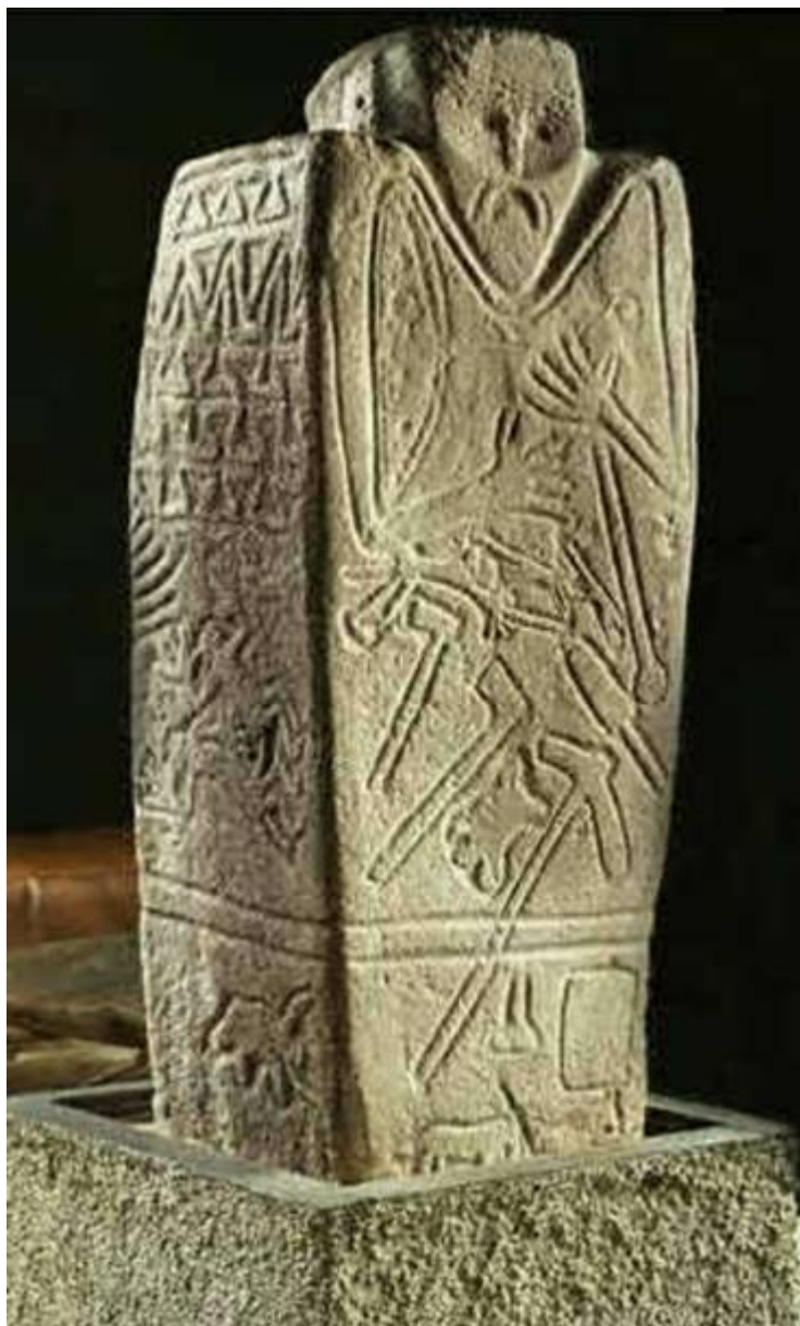
Idolo di Kernosovsky: 3000-2500 aev

Urheimat europea: un grande albero o un fiume in piena con effluenti?