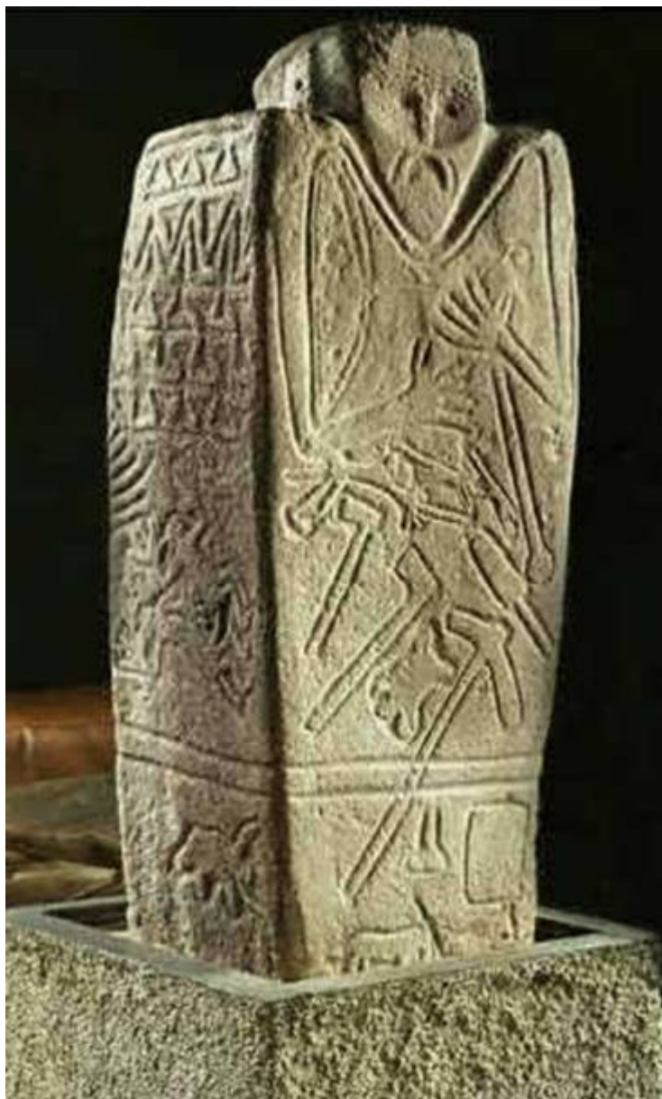
Idolo di Kernosovsky: 3000-2500 aev

Urheimat europea: un grande albero o un fiume in piena con effluenti?