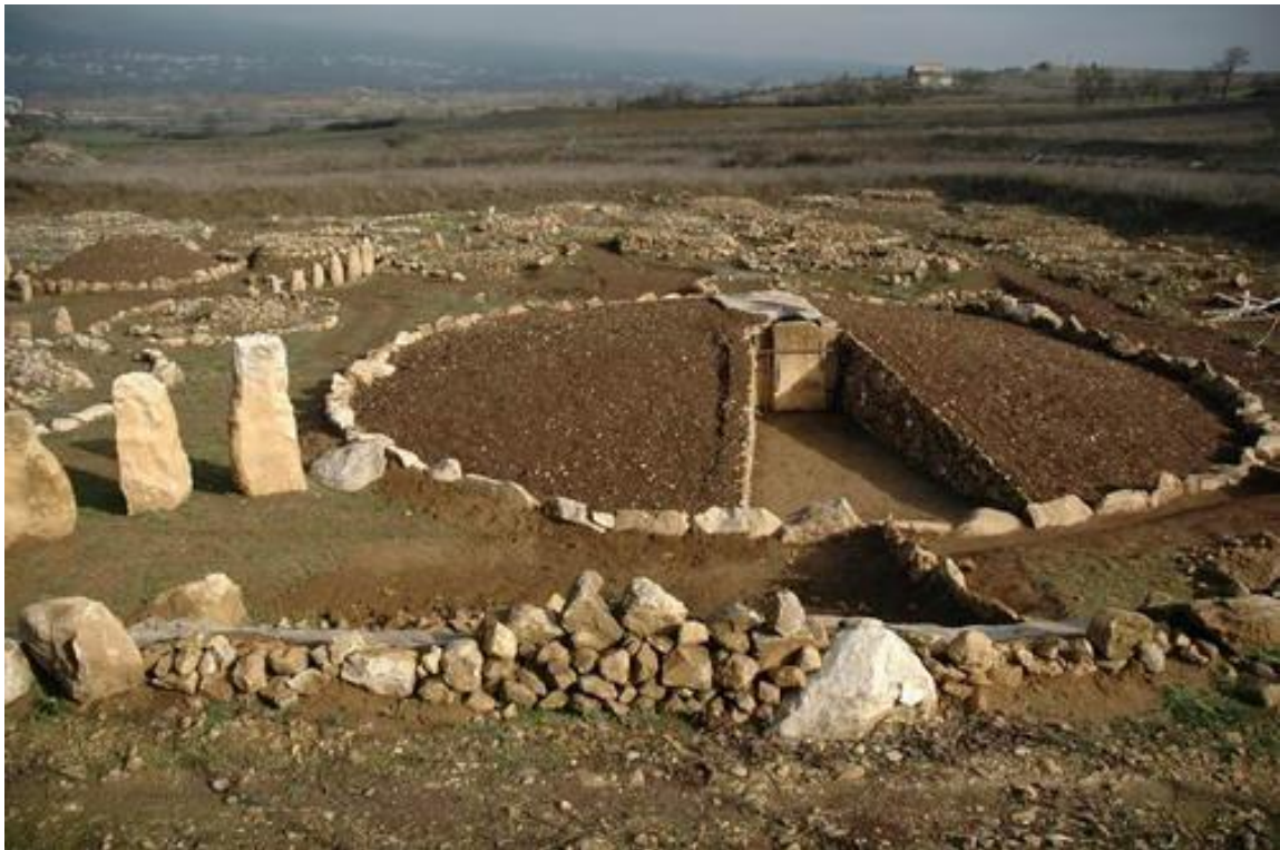
Tomba a circolo nella necropoli di Fossa (AQ)

L'espansione neolitica avvenne anche lungo le coste del Mediterraneo, toccando così la penisola italiana. Anche in questo caso gli archeologi identificano la cultura sulla base