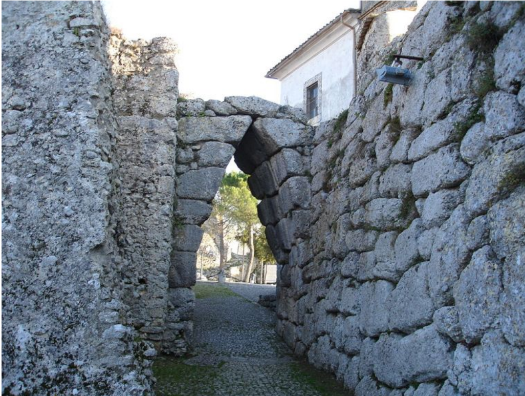
Mura poligonali di Arpino

un unico esempio in tutto il continente.