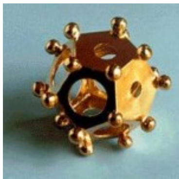
Dodecaedro romano di Tongeren

Prendiamo a modello il dodecaedro, completamente in bronzo, di Tongeren ( Atuatuca Tungorum , Belgio), conservato in stato ottimale nel locale museo gallo romano. Osservandolo da vicino vedremo che si tratta di un oggetto per nulla semplice.