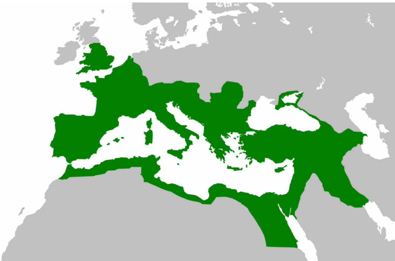
L'impero romano nell'anno 117 dell'Era comune