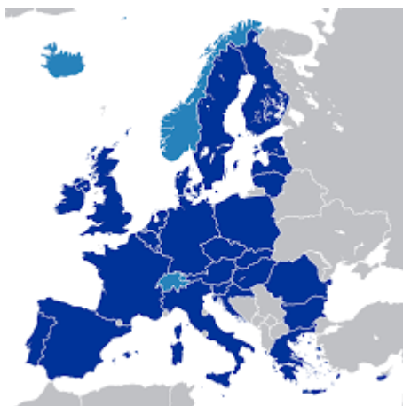
Unione europea (blu) e stati cooperanti (azzurro)

L'Unione Europea è un grande progetto incompiuto, lasciato a metà, in balia delle banche e con poca attenzione ai suoi cittadini. Se non ci credete, provate a cambiare paese. Nella mia discreta esperienza di traslochi internazionali, sono stato residente in quattro paesi europei differenti e ho vissuto ogni volta gli stessi problemi: cambiare la targa dell'automobile, cambiare la banca, il numero di telefono, l'assicurazione sanitaria e sparpagliare i miei anni di lavoro in sistemi pensionistici che spesso non si parlano tra loro. Tutto ciò comunque è nulla di fronte al cambio di lingua.