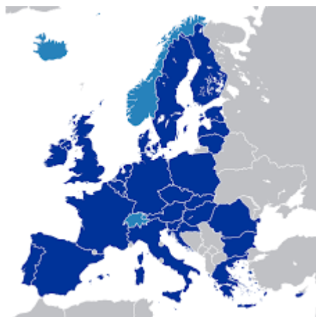
Unione europea (blu) e stati cooperanti (azzurro)

L'Unione Europea è un grande progetto incompiuto, lasciato a metà, in balia delle banche e con poca attenzione ai suoi cittadini. Se non ci credete, provate a cambiare paese. Nella mia discreta esperienza di traslochi internazionali, sono stato residente in quattro paesi europei differenti e ho vissuto ogni volta gli stessi problemi: cambiare la targa dell'automobile, cambiare la banca, il numero di telefono, l'assicurazione sanitaria e sparpagliare i miei anni di lavoro in sistemi pensionistici che spesso non si parlano tra loro. Tutto ciò comunque è nulla di fronte al cambio di lingua.