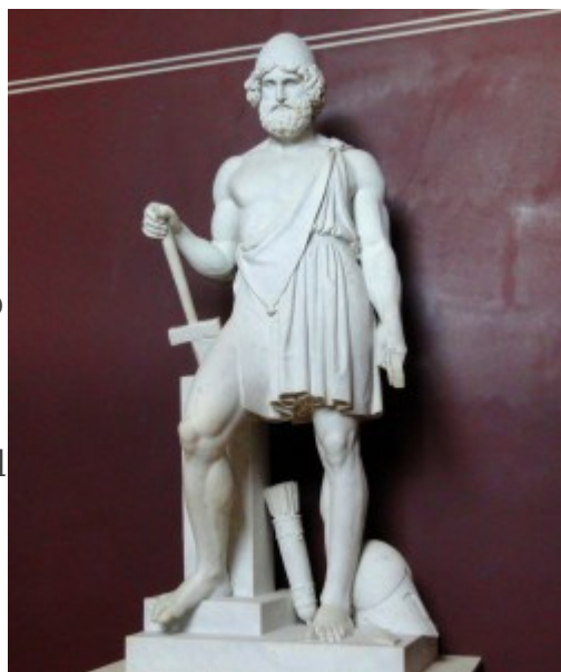
Vulcano, museo di Thorvaldsen

Le fonti romane poco ci dicono sul Fuoco, ma di ciò diremo avanti. Ci avvarremo, per colmare le nostre lacune, dello studio del Dumezil (3) sul Fuoco della religione vedica (IV sec. a.C.) che spiega quello di Roma in virtù delle comuni radici.