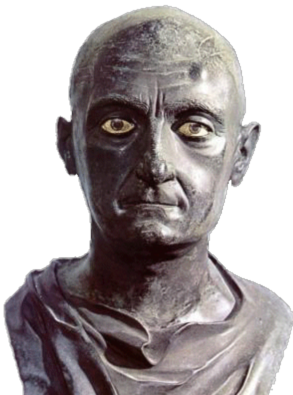
Publio Cornelio Scipione l'Africano