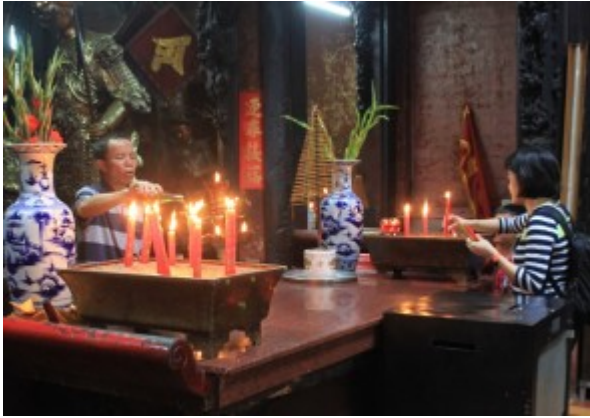
Offerte nella Pagoda dell'Imperatore di Giada a Saigon

Inoltre in tutta la campagna del Viet Nam si trovano tombe sparse a piccoli gruppetti, quasi mai veri cimiteri (solo in questi anni si sta cercando di raggrupparle). La tradizione vuole che il corpo dell'Antenato sia sepolto in risaia, anche non di proprietà (e nessuno si può opporre), su indicazione specifica dello sciamano del villaggio, il quale decide la posizione in base alle sue conoscenze di geomanzia in modo che gli spiriti possano trovare la strada di casa. Si tratta di strutture in marmo o in pietra dove però non si usa pregare, curare o pulire (quindi appaiono trascurate) perché gli spiriti non amano la luce e vanno ricordati solo in casa.