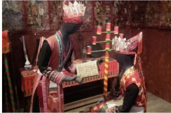
L'iniziazione dello sciamano al primogenito, ricostruzione, Museo etnografico di Hanoi