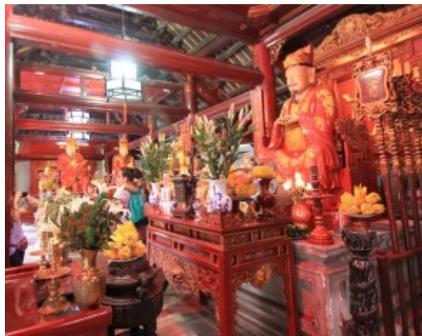
Altare di Confucio nel Tempio della Letteratura ad Hanoi