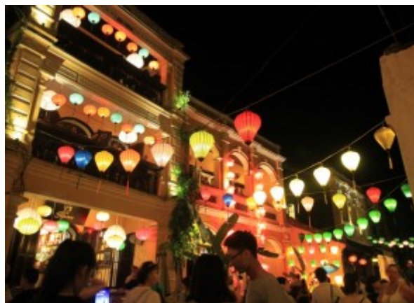
Festa del Plenilunio a Hoi An