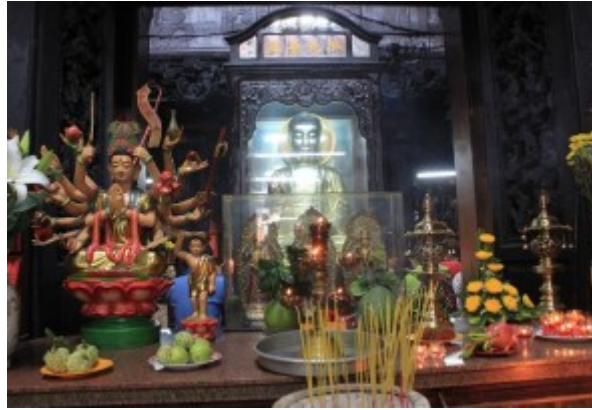
Altare di Budda nella Pagoda dell'Imperatore di Giada a Saigon