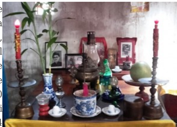
Altare degli Antenati in una casa

Le religioni però in Viet Nam, cosparso com'è di pagode e templi, hanno una lunga tradizione a partire proprio dal culto popolare, il quale è stato storicamente influenzato dal buddismo oltre che dal confucianesimo e dal taoismo cinesi - che però, più che religioni, sono corpi precettivi morali. Su 90 milioni di abitanti, 11 milioni oggi si dichiarano buddisti, oltre 6 milioni cattolici, 4 milioni e mezzo seguono il Cao daismo